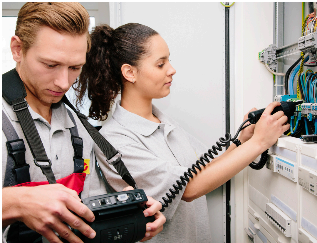
Die Installation einer steckerfertigen PV-Anlage sollte eine Elektrofachkraft durchführen

Weiterhin sind durch die Elektrofachkraft folgende Punkte sicherzustellen: