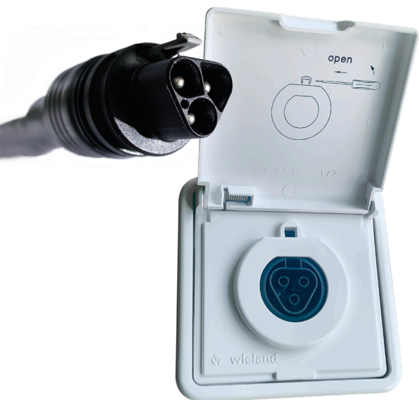
Einspeisesteckdose und Stecker einer steckerfertigen PV-Anlage